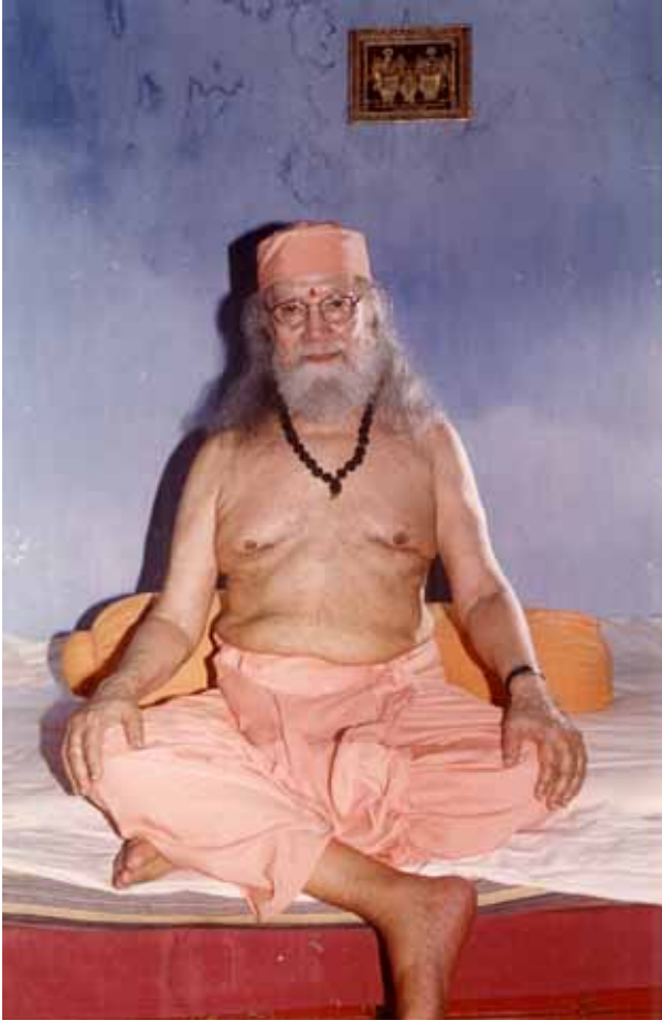
Paramahansa Hariharananda in India