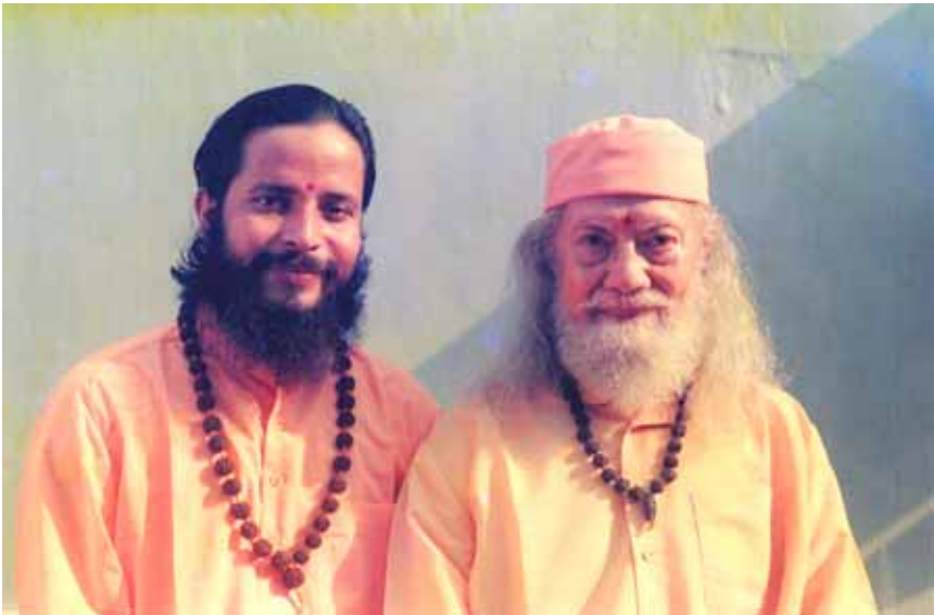
... met Paramahamsa Hariharananda in 1996