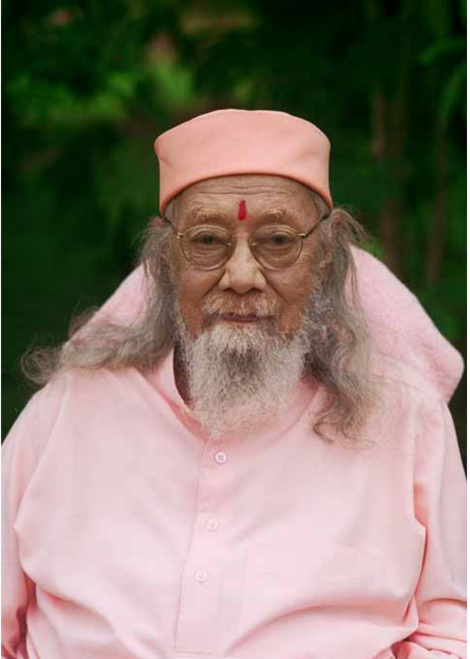
Paramahansa Hariharananda in de tuin van Homestead