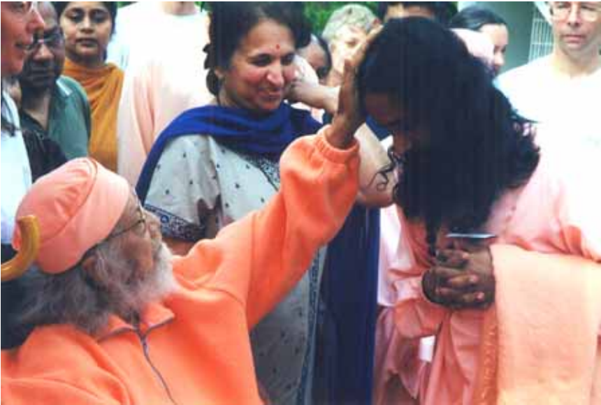
zegeningen van de meester